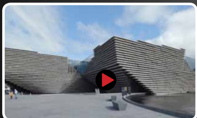
نگاهی اجمالی به موزه VA Dundee در کشور اسکاتلند