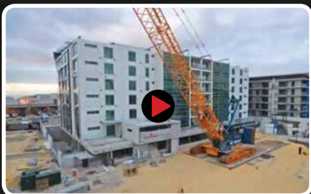
اجرای ۷۷ واحد آپارتمان در ۶ طبقه طی ۱۰ روز