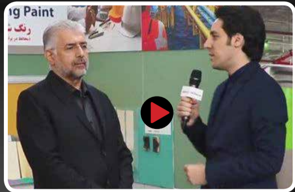
رئیس هیئت مدیره رنگ الوان در گفت و گو با "عصر ساختمان": توان تولید محصولات با کیفیت مورد نیاز پروژه های ملی را داریم