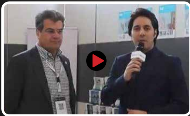
مدیرعامل شرکت برج سازان، نماینده شرکت کناف ایران در نمایشگاه CIDEX: محصولات متنوع کناف ایران، تحولی شگرف در اجرای سازه های خشک در کشور پدید آورده است