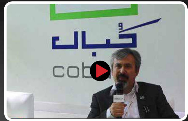
حضور تنها شرکت خدمات آنلاین ساختمانی در نمایشگاه توسعه صنعت ساختمان؛ کبال راه رسیدن به خدمات ساختمانی را آسان می کند