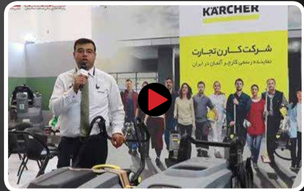
محصولات کارچر در نخستین نمایشگاه توسعه صنعت ساختمان cidex 2018