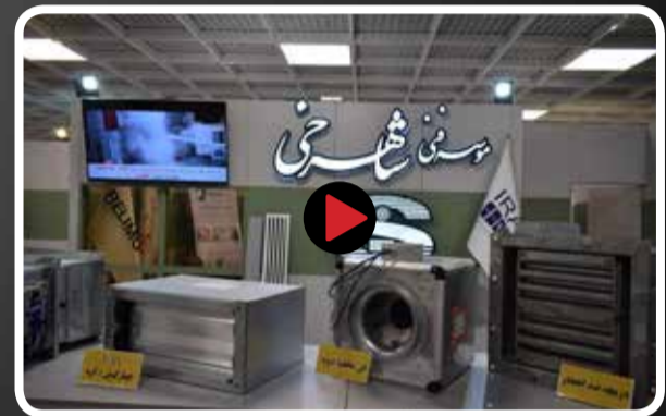
مدیرعامل موسسه فنی شاهرخی در گفتگو با "عصر ساختمان" گفت: