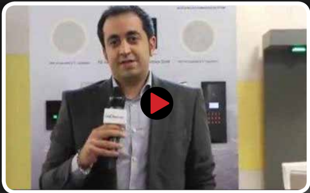
مدیرعامل شرکت HDL از قابلیت های فنی و اجرایی این مجموعه می گوید