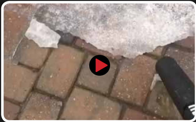
ابزاری فوق العاده از شرکت ماکیتا برای یخ زدایی معابر