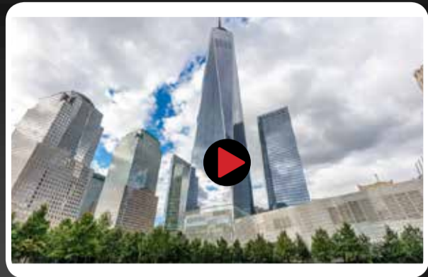
تایم لپس ساخت مرکز تجارت جهانی