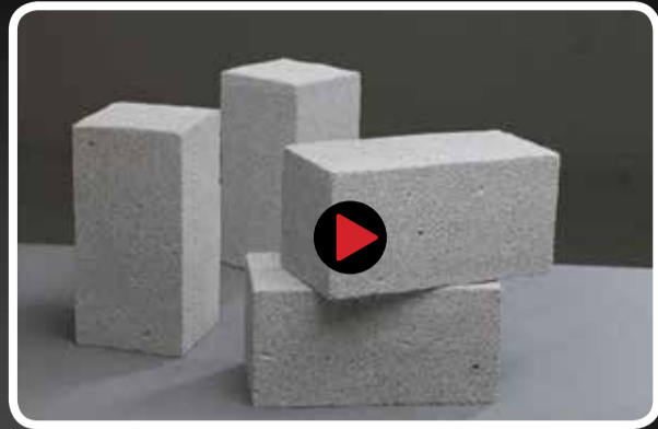
مصالحی با ویژگی خاص