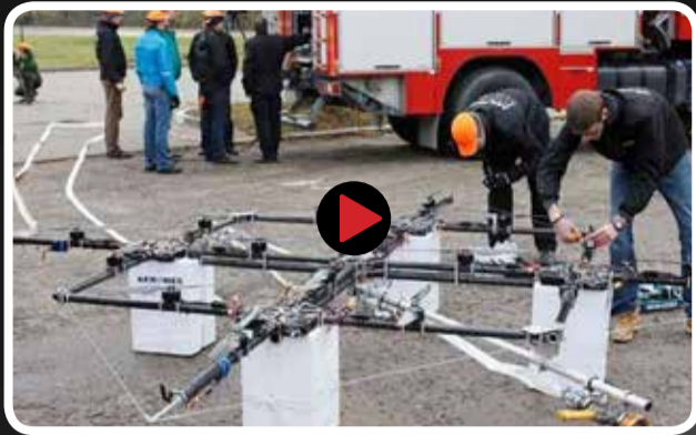
تکنولوژی در خدمت مدیریت بحران