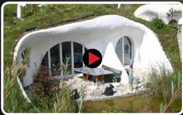
سکونت گاه‌های سبز